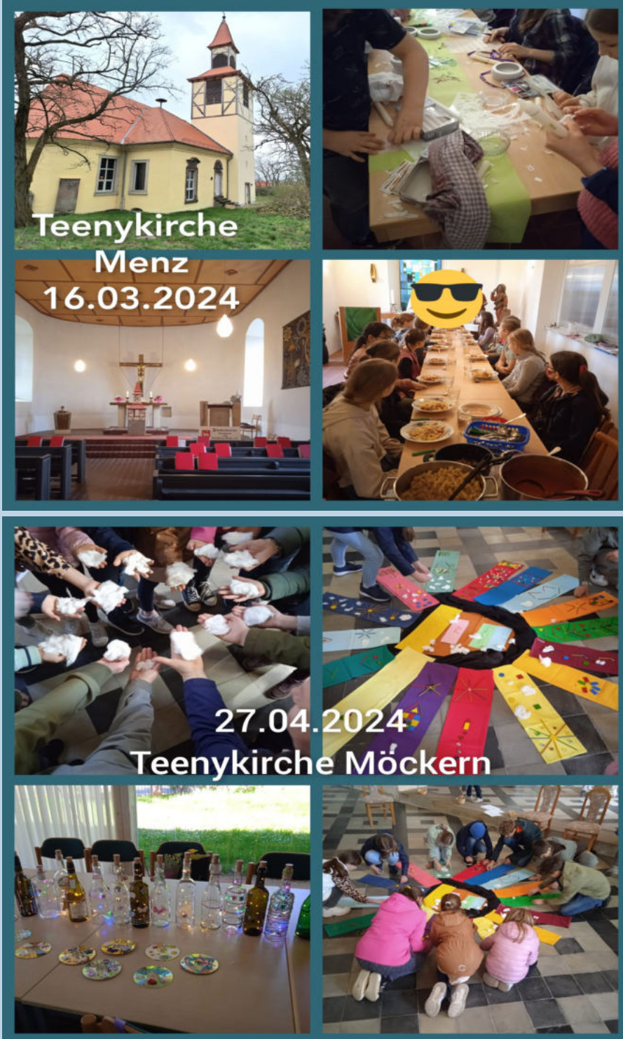
Teenykirche Menz 16.03.2024